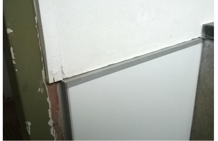
Om diverse deuren afwerklatjes geplaatst